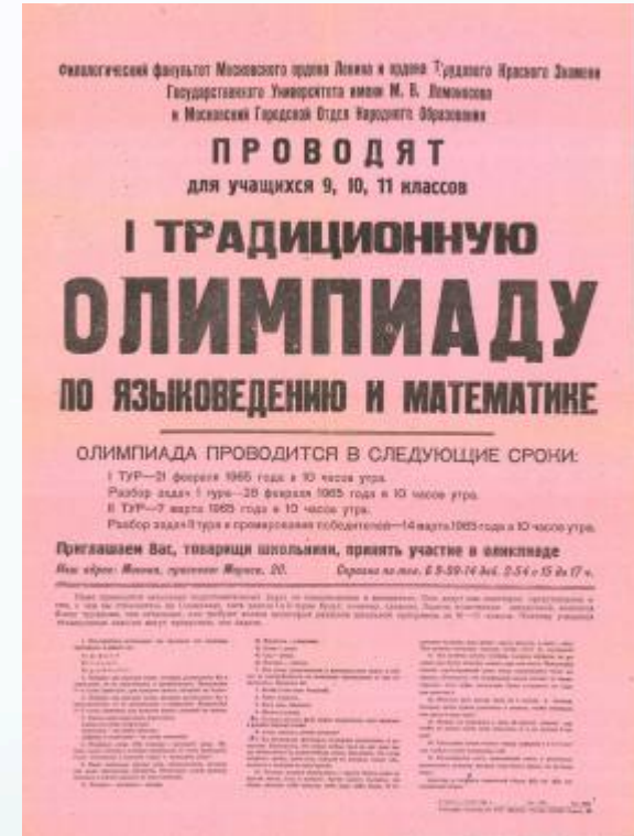
Традиционная олимпиада по лингвистике (ежегодно с 21.02.1965)