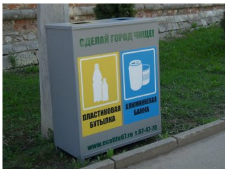
Тираж 100 экз.

Во многих странах Европы с некоторых пор существует практика селективного сбора мусора. Она подразумевает сортировку органических и неорганических отходов, которые должны уничтожаться особым образом. Иными словами, пластиковые бутылки отправляются на один пункт переработки, стеклянные – на другие. Такое разделение не только защищает окружающую среду от избытка вредных веществ, но и позволяет производить качественное вторсырьё, которое в дальнейшем также может пользоваться спросом. Во многих городах нашей страны можно найти контейнеры, предназначенные для разных видов отходов, поэтому опробовать эту практику сегодня может любой желающий.